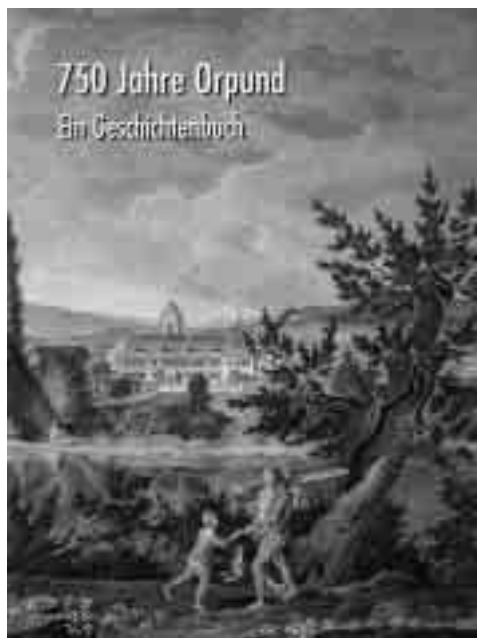
Die Festschrift «750 Jahre Orpund – Ein Geschichtenbuch»