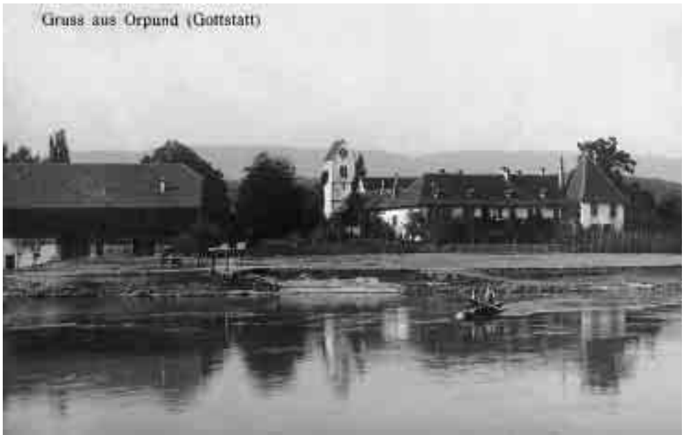
Gruss aus Orpund, Postkarte (vermutlich um 1910).

(aus «Regionales Gedächtnis», Gassmann AG, Biel)