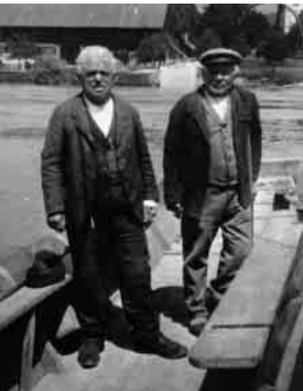
Die beiden Fährmänner. Für sie bedeutete der Bau der Gottstattbrücke 1926 den Verlust der Arbeitsstelle.

(aus «Regionales Gedächtnis», Gassmann AG, Biel)